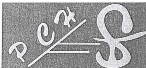
Pharmacie Centrale des Hôpitaux

Numéro d'Identifiant Fiscal : 000016001323281